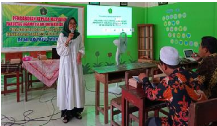
Gambar 4. Penyajian materi tentang Strategi Joyful Learning

Setelah guru mengungkapkan permasalahan yang sering terjadi pada pembelajaran dikelas dan menuliskan harapan-harapan untuk pelajaran dikelas selanjutnya tim pengabdian kepada masyarakat menyajikan materi tentang konsep Strategi Joyful Learning selama 60 menit.